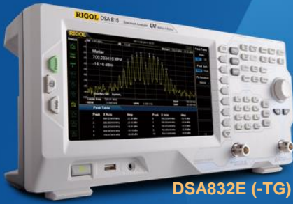
DSA832E (-TG) DSA832 (-TG) DSA875 (-TG)